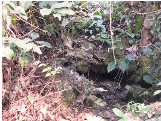
L'ancienne source est tarie

Nous allons à Pak Nga pour réceptionner la nouvelle installation d'eau courante. Il y a trois ans, la source qui alimentait initialement le lycée a cessé de couler. Après des vérifications en 2023 pour être sûr de ne pas être en face d'un événement du type « Manon des sources », nous avons étudié le captage d'une source de l'autre côté de la rivière Nam Ou. Ce projet a nécessité la construction d'une nouvelle tête de source et d'un dispositif de traversé de la rivière. Le réseau du lycée, les fontaines, le grand réservoir ont été réutilisés.