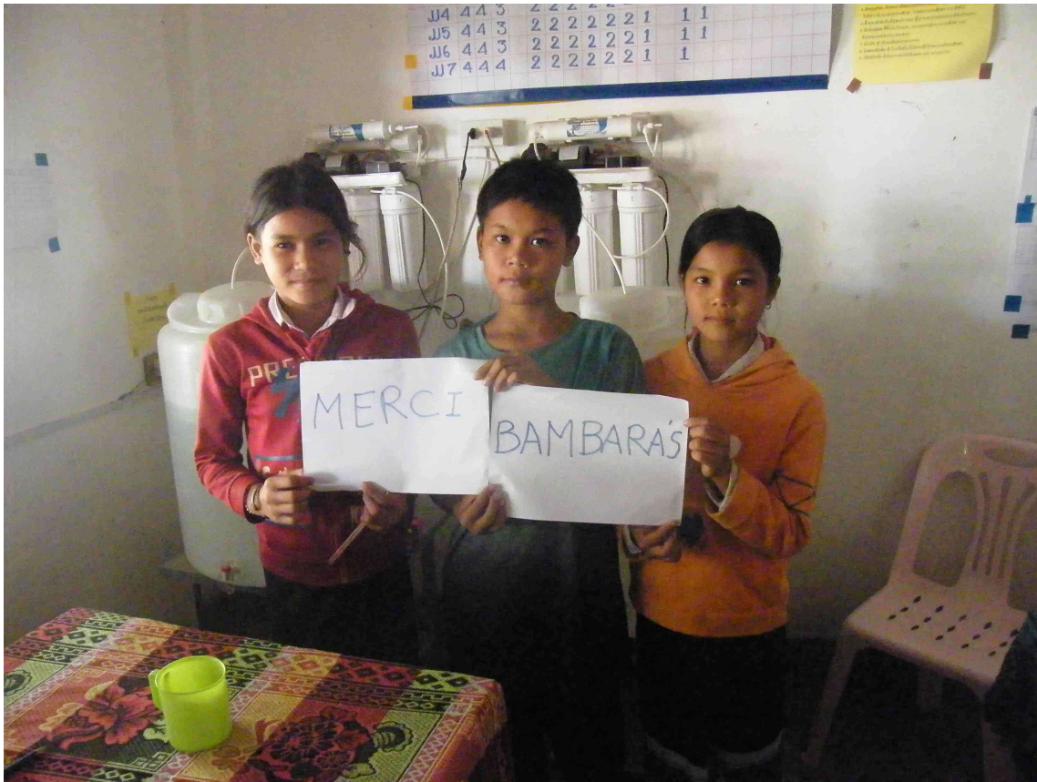
Les deux derniers filtres. Les enfants remercient leur sponsor