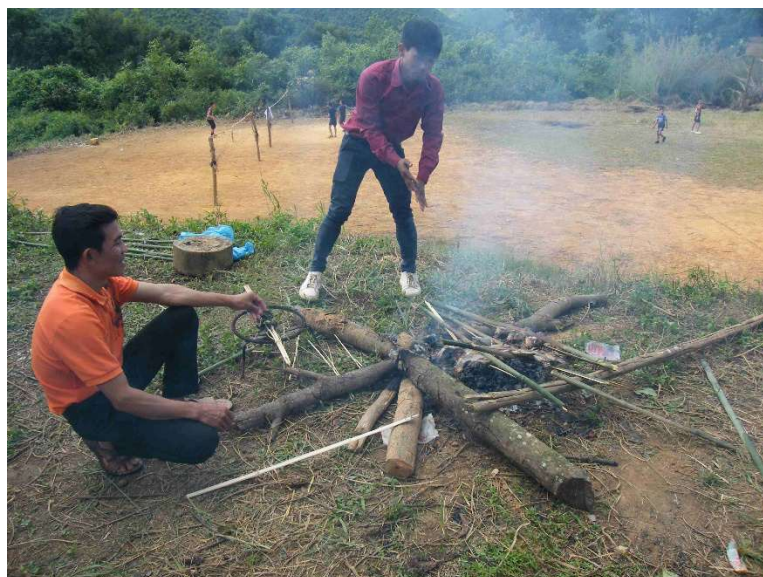
Les professeurs font griller le poisson

Connaissant la pauvreté du lycée et du village nous avons apporté de la nourriture (poissons et bière) et nous avons invité tous les professeurs pour un déjeuner joyeux.