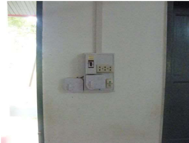
Un des deux tableaux électrique

Les installations électriques ont été réalisées conformément au devis