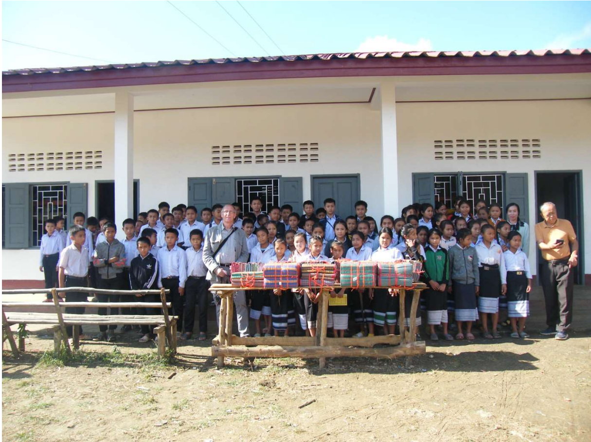
Remise officielle des nattes.

Une deuxième visite a été effectuée le 17 novembre pour apporter au collège une cinquantaine de nattes préalablement achetées à Luang Prabang.