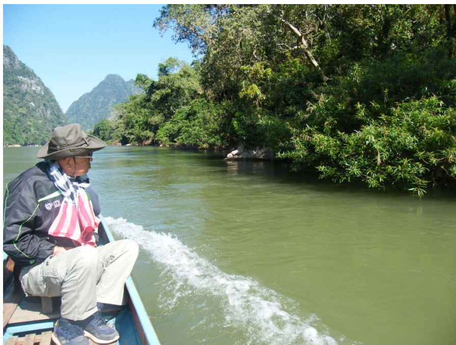
Retour en pirogue en fin de journée