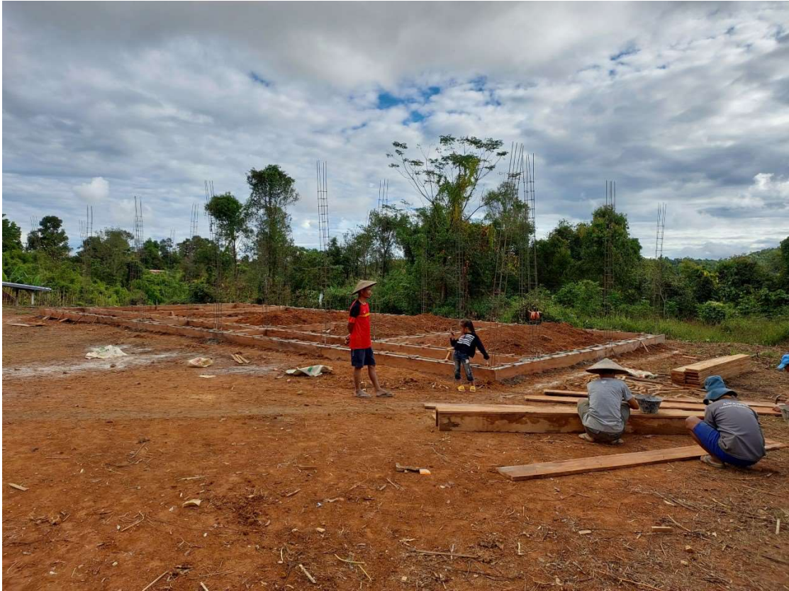
Le chantier le 20 novembre 2020