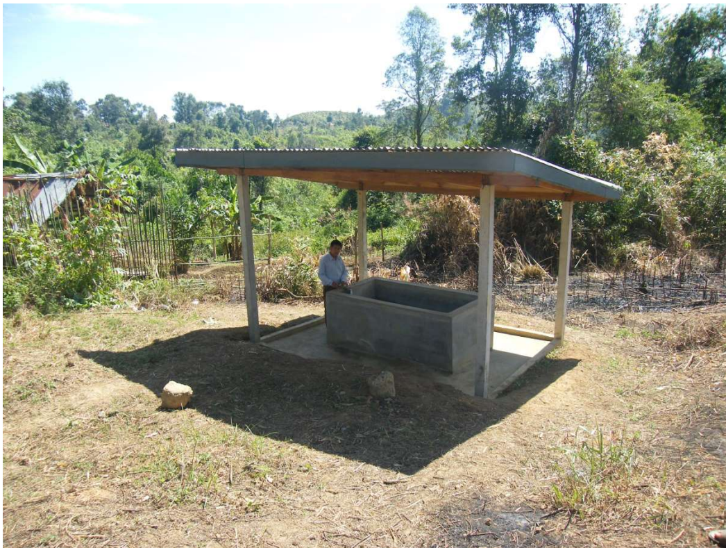
Un des deux bassins lavoirs

Nous visitons les équipements de distribution d'eau. Pendant les constructions nous avons suivi le chantier en détails grâce à de nombreuses photos et films. Les équipements sont conformes aux plans. N'étant pas équipé pour un trek en jungle, Je ne suis pas allé voir la tête de source Des villageois iront plus tard et m'enverront des photos. Les deux bassins lavoirs sont opérationnels