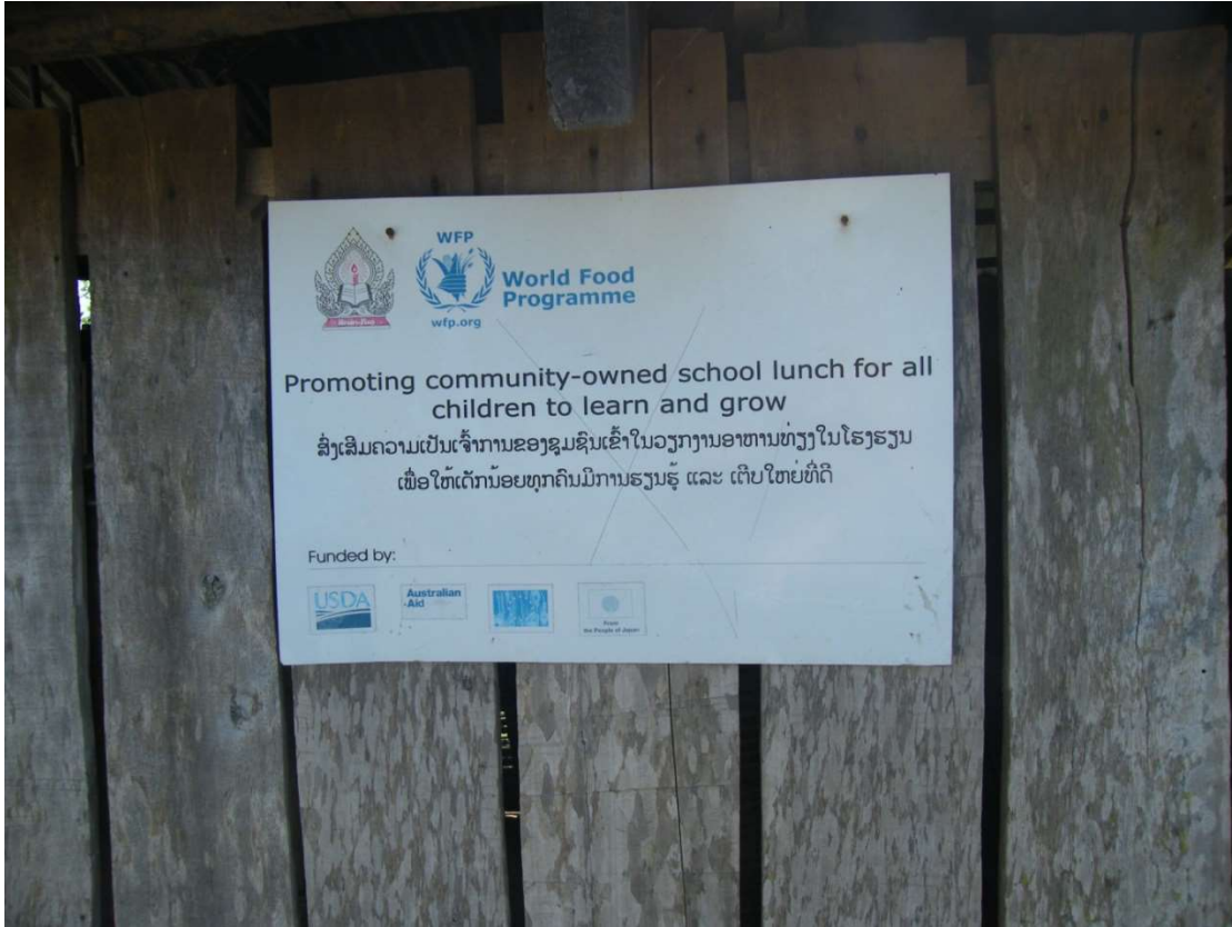
C'est grâce à cette organisation onusienne que nous avons été alertés sur les problèmes du lycée